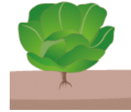
FORMACIÓN DE CABEZA